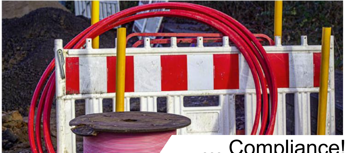
BILD-Recherche deckt einen Sumpf aus Bestechung, Vetternwirtschaft und Selbstbedienung auf