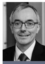
Norbert Westfal Präsident BREKO Bundesverband Breitbandkommunikation e. V.