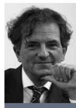
Theo Weirich Präsident BUGLAS Bundesverband Glasfaseranschluss e. V.